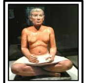
Les scribes d'Égypte