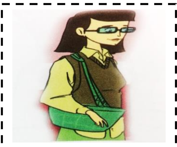
La m aman