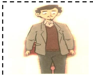
Le p apa