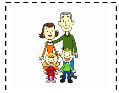
La f amille