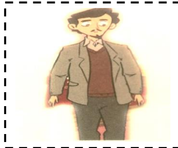
Le p apa