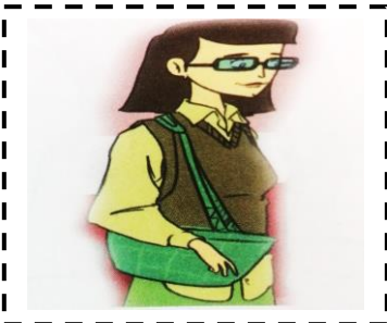
La m aman