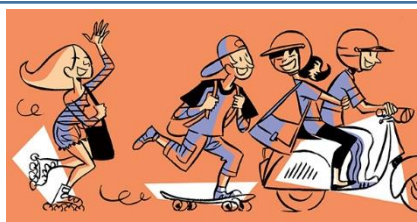
Nous jouons dans la rue