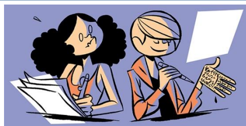
je triche à l'examen