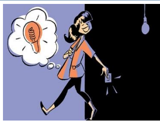
J'éteins la lampe quand je sors