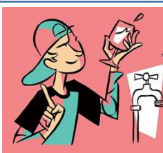
Je bois dans ma tasse