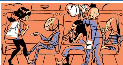
Je jette les déchets sur mes amis